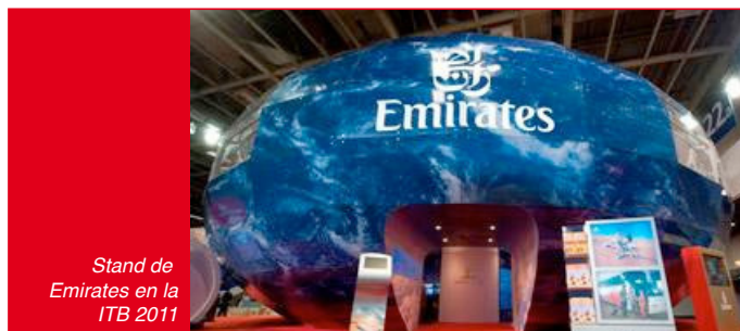
Stand de Emirates en la ITB 2011

En la edición de este año de la ITB, Emirates ha modificado su stand, el Emirates Globe, para otorgarle el máximo protagonismo al A380. Y lo ha hecho exhibiendo réplicas en tamaño real del Onboard Shower Spa y de la Onboard Lounge incorporadas a la estructura rotatoria. "El Emirates Globe es un stand que ya despertaba habitualmente la admiración de toda la industria de viajes y turismo, pero ahora hemos conseguido incluso mejorarlo trayendo lo mejor del A380 hasta el mismísimo corazón de la mayor feria profesional de viajes del mundo," recalcó Tim Clark, Presidente de Emirates Airline.