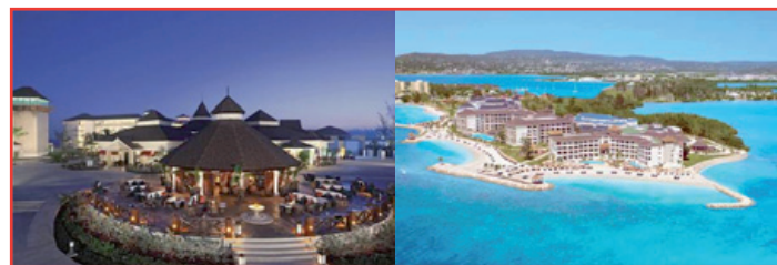
Secrets St. James & secrets Wild Orchid

Montego Bay conta com dois novos hotéis tudo-incluído da cadeia Secrets: o Secrets St. James e o Secrets Wild Orchid, que entre os dois somam 700 quartos, oito restaurantes internacionais, nove bares, várias piscinas, um spa de quase 1.400m 2 e um teatro ao ar livre. www.secretsresorts.com .