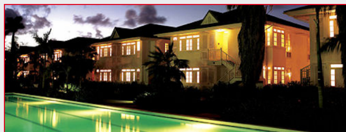
Half Moon Resort, Montego Bay