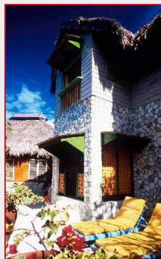
The Caves, Negril

Na passada edição dos prémios anuais “Best of the Caribbean” Readers’ Choice Awards organizados pela revista de viagens estadunidense “Caribbean Travel + Life’s”, Jamaica recebeu o reconhecimento máximo em duas categorias e obteve, além disso, outras cinco menções especiais. Concretamente, os 17.000 leitores da revista que participaram na votação consideraram a cerveja jamaicana “Red Stripe” como “a Melhor Cerveja das Caraíbas” e o Rick’s Café de Negril como o estabelecimento organizador da “Melhor Happy Hour.” Além disso, a ilha também se destacou nas categorias “Melhor Destino em geral”, “Melhor Festival” pelo Reggae Sumfest, “Melhor Rum” pelo Appleton, “Melhor Resort de Golfe” pelo Half Moon em Montego Bay e “Melhor Resort Romântico” por The Caves, em Negril.