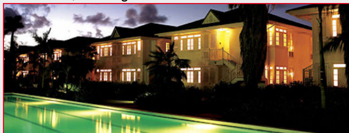
Half Moon Resort, Montego Bay